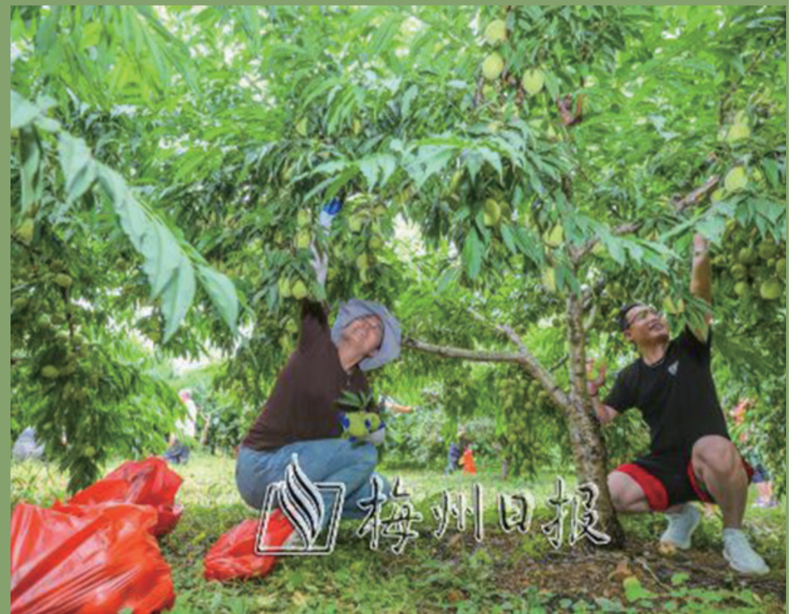
蕉嶺縣廣福鎮桃花源莊鷹嘴桃開摘，吸引大批市民前去體驗。