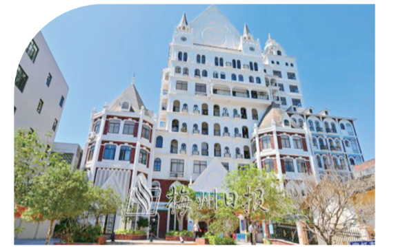
鴻藝集團投資3200多萬元新建小都衛生院新大樓并配備先進醫療儀器，方便周邊群眾就近就醫。

“目前，已有143家縣內外企業結對幫扶五華的308個行政村，但與我們的414個行政村