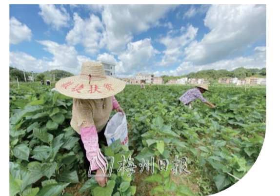
在琴口村的桑芽菜示範種植產業基地，村民們正忙著採摘桑芽菜。