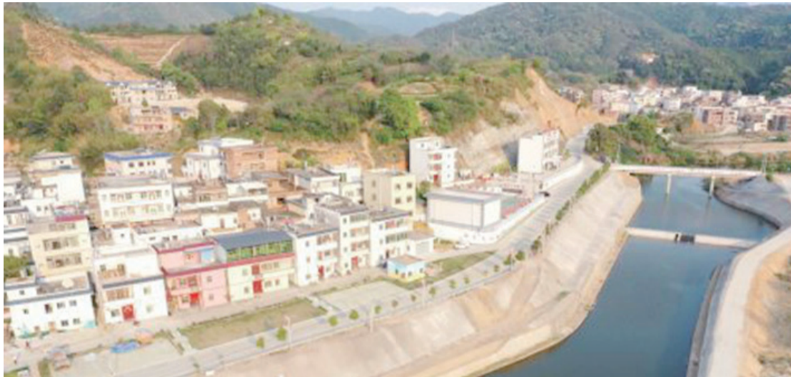
敏捷集團助力龍村鎮實施“四村聯動”美麗鄉村項目。圖為大梧村新貌。

實現全結對覆蓋的目標仍存在不小差距。”張德祥說，接下來相關部門將進一步壓實工作責任、拓寬幫扶渠道、加強宣傳力度，多措並舉，力爭年底實現所有行政村都有企業結對幫扶的目標。據了解，今年五華將充分調動社會力量，積極發動企業、鄉賢參與到農房管控與鄉村風貌提升工作中，全力打造生態宜居美麗鄉村。(賴鋒 張炳鋒 郭思敏)